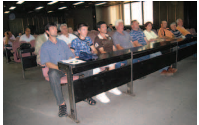
Сасћанак у ојћћини Призрен

Овога пута, општински званичници су им обећали да ће се озбиљним повратницима градити куће. Остало је само да се идентификују “озбиљни повратници”. Сви учесници посете истичу да су озбиљни повратници, да им вољу за повратак дају комшије из села које су их и овога пута искрено и пријатељски дочекале. Комшије су са њима обишле поред имања и сеоску цркву и гробље.