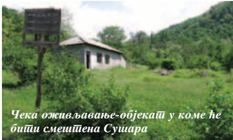
Чека оживљавање-објекат у коме ће бити смештена Сушара

Не ради се само о познатим врстама лековитог биља (камилица, нана, хајдучка трава), већ и о мање познатим, а врло лековитим врстама биља, као што су јагорчевина, подбел, дивизма, подубица и многе друге врсте. Како тврде добри познаваоци ове проблематике, у крајевима Средачке жупе наведених, али и других лековитих биљака, има у изобиљу. Поред тога, у жупи постоји дугогодишња традиција сакупљања боровница, клеке, дивљих јабука, које су изванредна сировинска база за справљање многих препарата.