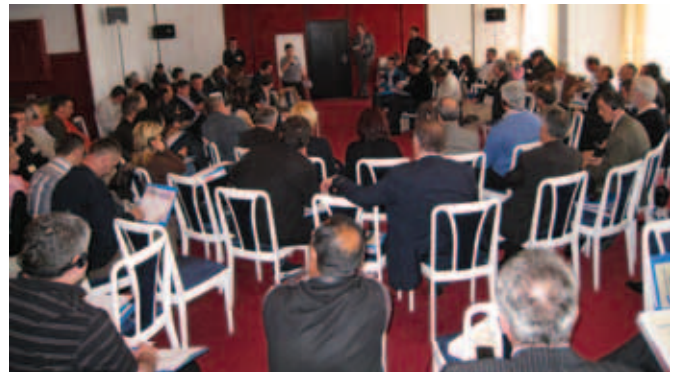
Детаљ са Радионице у Улцињу

Зато је и јасно да ослужбеници за повратак и службеници за заједнице, не би требало да буду само проста трансмисија одлука власти у Приштини, како међународних тако и привремених, већ и да се заложу да до власти допру и захтеви људи за повратком и шта то треба испунити да до њега дође. С друге стране, НВО на терену треба да се труде да жеља ИРЛ за повратком не посустане. То се може постићи