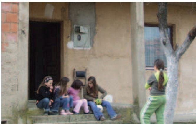
Најмлађи повраћници у Видање

Слична ситуација се догодила и на прелазу из северног дела у јужни део Косовске Митровице, како је удружење “Југ “ Краљево, чланицу Уније, обавестио