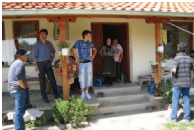
...и њовајшника у селу Новакe.

Фотографије: Златко Маврић, јун 2008. године