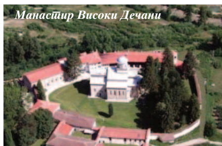
Манастир Високи Дечани

Али, пођимо редом. “Број припадника српског народа пре ратних збивања износио је 830, не рачунајући две хиљаде избеглица српске националности из Албаније које су се деведесетих година доселили у Дечане, односно околна села. Након прогона неалбанског становништва, сви Срби су напустили ову општину 12. јуна 1999. године. О онима који су остали, а ради се о