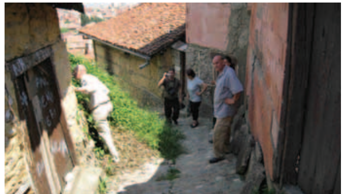
Пошкарљаја: снимак за оне који нису могли да дођу

гробних места у 2008. години. На захтев једног од расељених да се уради мермерни крст са исписаним