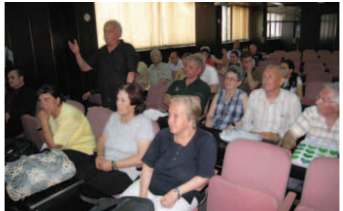
Расељени на састанку у СО Призрен

Уместо речи охрабрења, осим речи добродошлице, ништа није указивало на то. Прве речи званичника су