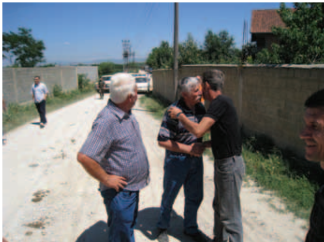
Срдчан сусрећ с комишијама Албанцима...