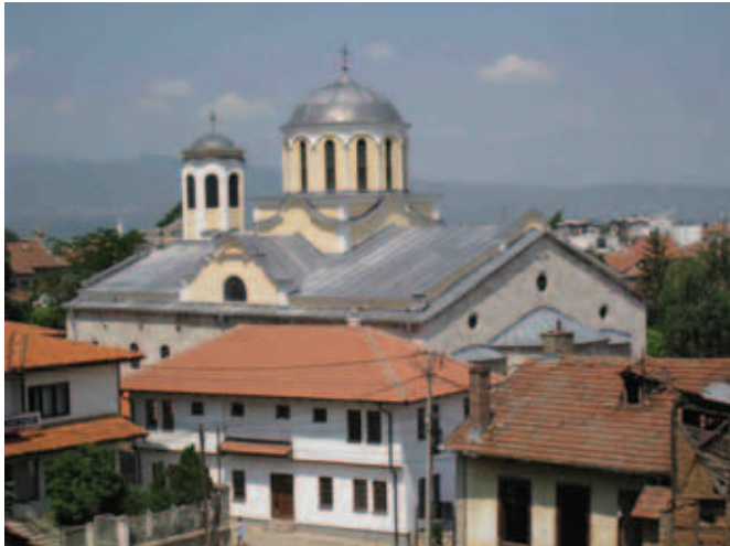
Обновљена Саборна црква у Призрену

У организацији Данског савета за избеглице (ДСИ), већа група интерно расељених лица (ИРЛ), имала је прилику да, почетком јуна месеца, обиђе своје домове, у настојању да нађу решење за реконструкцију истих у циљу повратка. Група од 15 расељених, обишла је своје домове и видно потресена оним што су на лицу места видели, са убеђењем да ће од општинских власти и представника међународне заједнице добити охрабрујуће информације о могућностима за реконструкцију и