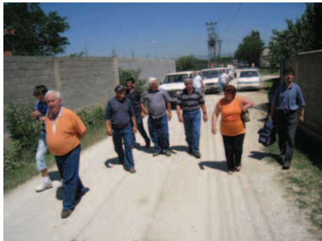
...до Горње Србице.